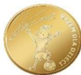
Dukat Roberta Lewandowskiego